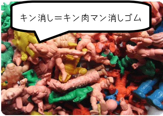
キン消し=キン肉マン消しゴム