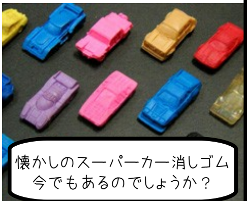
懐かしのスーパーカー消しゴム 今でもあるのでしょうか？

る塩化ビニール製品物差しやプラスチックトレー側にも可塑材の影響が出て、融合してしまうのです。