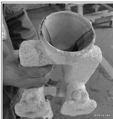
株式会社金子商会

写真のように「砂型」が出来上がりました。この「砂型」のことを「鋳型」とも言います。