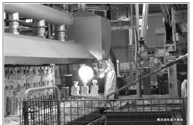
株式会社金子商会

砂型に溶けたステンレス鋼を流し込みます。この工程も手作業です。時間がかかりすぎると途中で冷めてしまい温度差によって品質が変化し