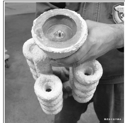
株式会社金子商会