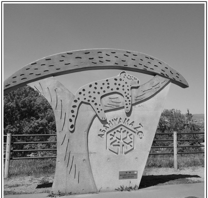
株式会社金子商会

この動物園は、動物の自然な生態が見られる行動展示を実施して一九九七年以降入園者数が増加し、現在、北海道を代表とする観光地として有名になったところではあります。