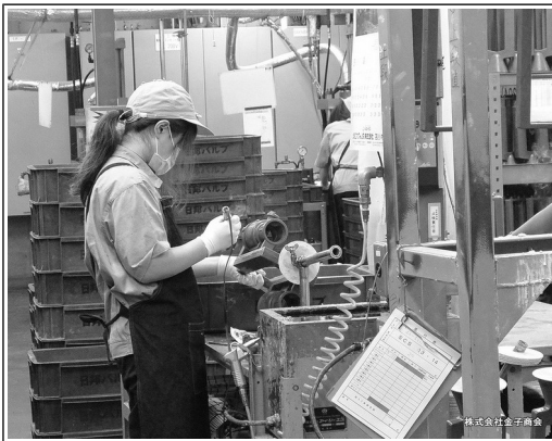
株式会社金子商会

写真を交えながら、簡単に説明します。 まずは、継手の形をした「型」を蠟のような特殊な樹脂