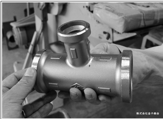
株式会社金子商会

何度も利用します。 商品の表面に付いている砂を落として、不要な突起などを削り取ります。できたての継